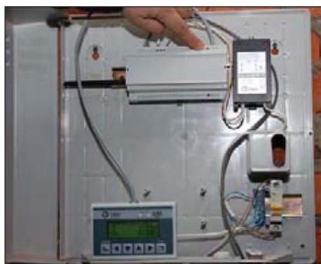
Рис. 9. Домовой контроллер КМ-ДZ с подключенной операторской панелью

янно содержится нарастающий итог объема потребленной воды с момента последней проверки счетчиков. Счетчики-регистраторы КМ-К-3Z выполняют также тарификацию потребленной воды, контроль качества связи со счетчиками воды, состояние их крышек (открыты или закрыты), контроль собственной батареи питания и других возможных ошибочных состояний. С целью экономии батарей, работа которых рассчитана на 4 года, счетчики-регистраторы КМ-К-3Z выходят на связь со своими «родительскими» маршрутизаторами один раз в час. Во время сеанса связи они передают накопленные данные о потребленной воде и статистическую информацию своему маршрутизатору, который, в свою очередь, сохраняет эти данные в буфере. Кроме того, в этот момент маршрутизатор синхронизирует часы конечных узлов и передает им сообщения от домового контроллера об изменении конфигурационных параметров, если такие имеются к данному моменту. Маршрутизаторы передают информацию выше по запросу центрального узла сбора данных КМ-ДZ. Кроме собственно информации, полученной от квартирных счетчиков-