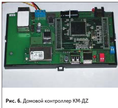
Рис. 6. Домовой контроллер KM-DZ