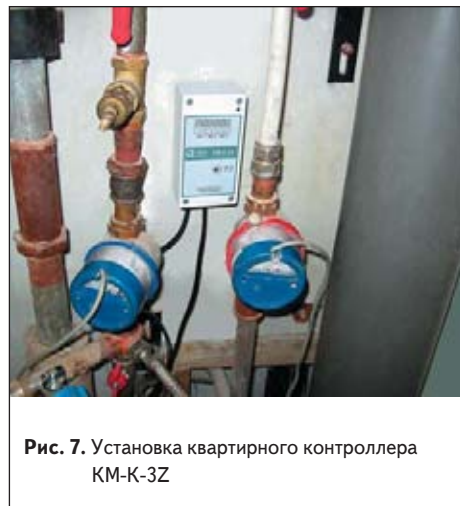
Рис. 7. Установка квартирного контроллера KM-K-3Z