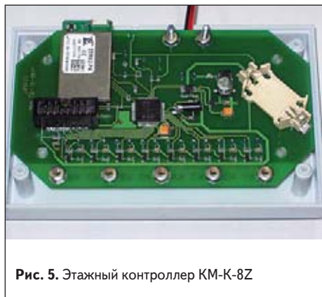
Рис. 5. Этажный контроллер KM-K-8Z