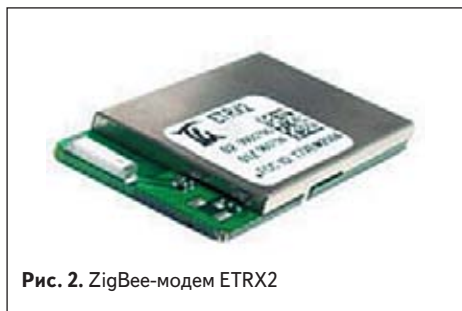
Рис. 2. ZigBee-модем ETRX2

Компания Telegesis специализируется на разработке устройств для сетей ZigBee. Инженеры Telegesis первыми разработали для своего радиомодуля систему AT-команд, предложив тем самым взглянуть на него как на ZigBee-модем. Сегодня встроенное программное обеспечение модемов ETRX2, с одной стороны, является тщательно продуманным и мощным программным продуктом, а с другой — обеспечивает для пользователя максимальную