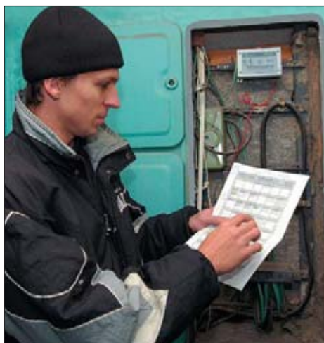
Рис. 8. Установка этажного контроллера КМ-К-8Z

янно содержится нарастающий итог объема потребленной воды с момента последней проверки счетчиков. Счетчики-регистраторы КМ-К-3Z выполняют также тарификацию потребленной воды, контроль качества связи со счетчиками воды, состояние их крышек (открыты или закрыты), контроль собственной батареи питания и других возможных ошибочных состояний. С целью экономии батарей, работа которых рассчитана на 4 года, счетчики-регистраторы КМ-К-3Z выходят на связь со своими «родительскими» маршрутизаторами один раз в час. Во время сеанса связи они передают накопленные данные о потребленной воде и статистическую информацию своему маршрутизатору, который, в свою очередь, сохраняет эти данные в буфере. Кроме того, в этот момент маршрутизатор синхронизирует часы конечных узлов и передает им сообщения от домового контроллера об изменении конфигурационных параметров, если такие имеются к данному моменту. Маршрутизаторы передают информацию выше по запросу центрального узла сбора данных КМ-ДZ. Кроме собственно информации, полученной от квартирных счетчиков-