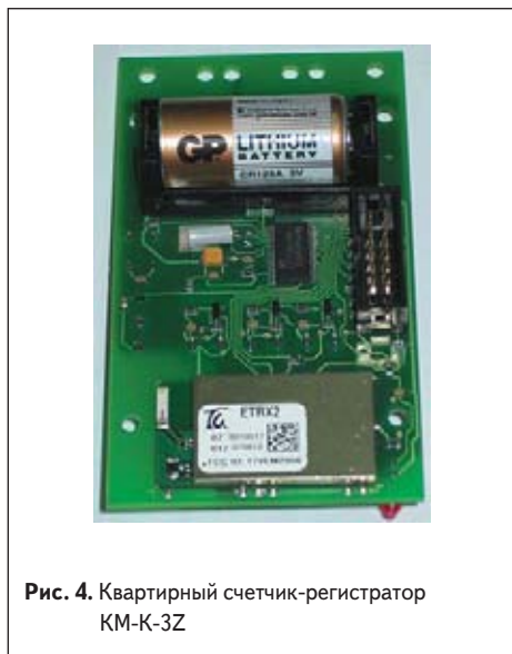
Рис. 4. Квартирный счетчик-регистратор KM-K-3Z

Так, первичные счетчики-регистраторы KM-K-3Z имеют буфер, в котором посто-