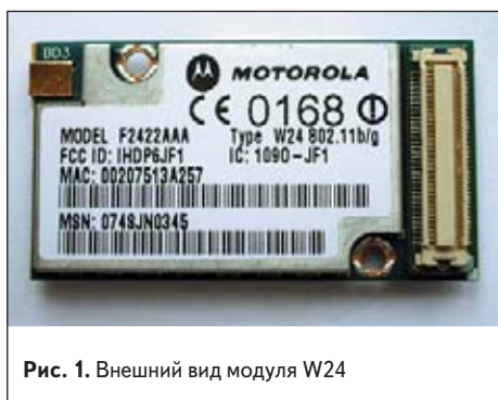
Рис. 1. Внешний вид модуля W24

В модуле W24 предусмотрено 3 различных конфигурации каналов: Европа — 13 каналов, США — 11 каналов, Япония — 14 каналов. W24 может работать в двух режимах: Infrastructure Station Mode (рассмотренный выше) и Ad-Hoc Station