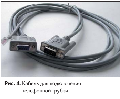
Рис. 4. Кабель для подключения телефонной трубки

с внешними цепями предусмотрен вывод V_{ref} , который определяет рабочее напряжение на линиях GPIO. Возможный диапазон этих сигналов можно настраивать в пределах от 2,6 до 15 В. Если на вывод V_{ref} не подавать никакого напряжения, то линии GPIO будут работать с уровнем 2,6 В. Управлять линиями GPIO можно простыми AT-командами. Например: