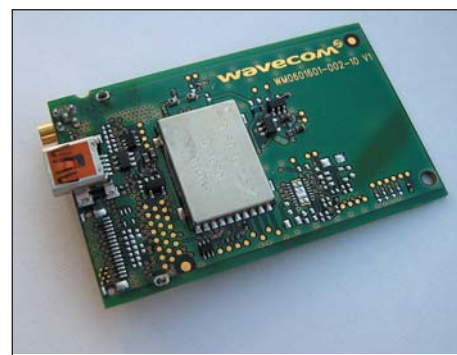
Рис. 3. Карта расширения IESM GPS

цию. Fastrack Xtend, по сравнению с Fastrack Supreme, имеет несколько больший корпус (89×60×30 мм). Для улучшения параметров приемного устройства в сетях 3G на корпусе установлено два разъема для подключения основной и дополнительной антенны. В сетях GSM дополнительная антенна не требуется.