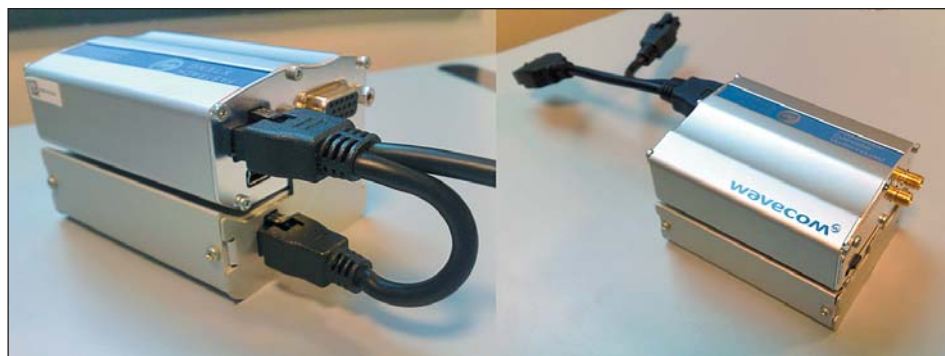
Рис. 2. Вид внешней резервной батареи