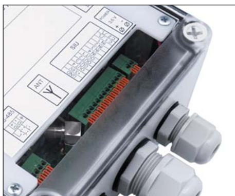
Рис. 6. GSM-модем AnCom RM/K: четыре дискретных входа телесигнализации; четыре дискретных выхода телеуправления

Помимо повышения эффективности предупреждения и ликвидации аварийных ситуаций или несанкционированного проникновения на узел учета, наличие подобных цифровых