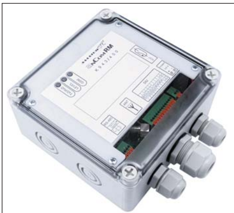
Рис. 1. AnCom RM/K: класс защиты IP67; диапазон рабочих температур -40...+70\text{ }^{\circ}\text{C} ; Li-SOCl 2 батарея (до 5 лет автономной работы)

устройствам экранированными кабелями через гермовводы для обеспечения герметизации внутренней части модема (рис. 1).