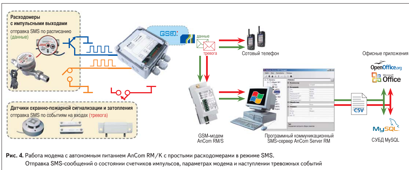
Рис. 4. Работа модема с автономным питанием AnCom RM/K с простыми расходомерами в режиме SMS. Отправка SMS-сообщений о состоянии счетчиков импульсов, параметрах модема и наступлении тревожных событий