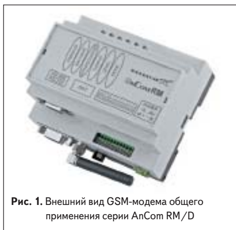
Рис. 1. Внешний вид GSM-модема общего применения серии AnCom RM/D

В предыдущих обзорах [3] мы уже рассматривали проверенные временем и зарекомендовавшие себя как надежные и функциональные модули серии Q26 и их применения [4]. В данной статье подробнее остановимся на одной из последних