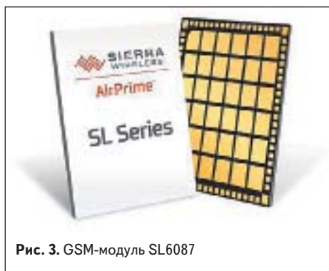
Рис. 3. GSM-модуль SL6087

разработок компании — модуле SL6087 серии AirPrime (рис. 3). Основным отличием SL6087 является компактный и легкий корпус LGA. Модули AirPrime SL представлены в двух вариантах: с поддержкой EDGE (AirLink SL6087) и HSDPA (AirPrime SL808x).