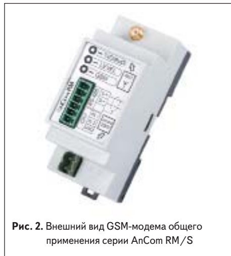
Рис. 2. Внешний вид GSM-модема общего применения серии AnCom RM/S