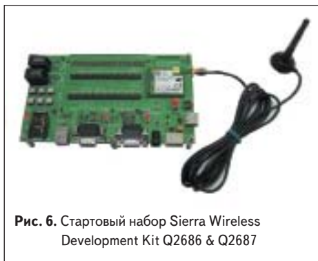
Рис. 6. Стартовый набор Sierra Wireless Development Kit Q2686 & Q2687

работу на отладочном комплекте, который использовался при разработке GSM-модемов AnCom (рис. 6). Отладочный комплект позволяет протестировать все доступные сервисы GSM-модуля Sierra Wireless.