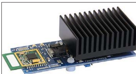
Рис. 4. Оценочный набор, демонстрирующий возможность использования термоэлектрических преобразователей для питания ZigBee-радиомодулей

преобразователи TE-CORE и оценочный набор для них, демонстрирующий их способность обеспечивать питание беспроводного модуля ZigBee (рис. 4). Он также сравнил их энергетический потенциал при разных температурных условиях с потенциалом стандартных батарей разного типа, показав, что термогенераторы в определенных приложениях могут даже обойти по среднегодовой энергетической емкости аккумуляторные батареи.