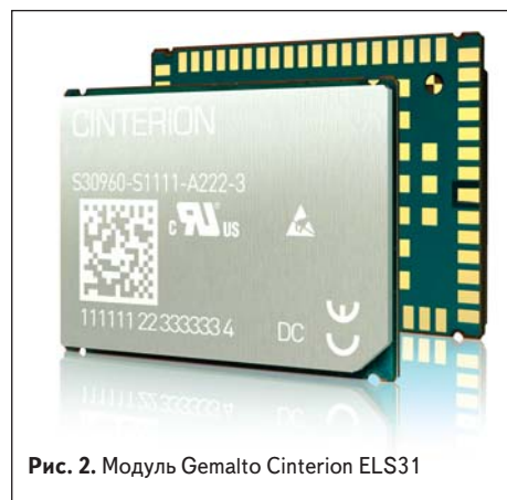
Рис. 2. Модуль Gemalto Cinterion ELS31