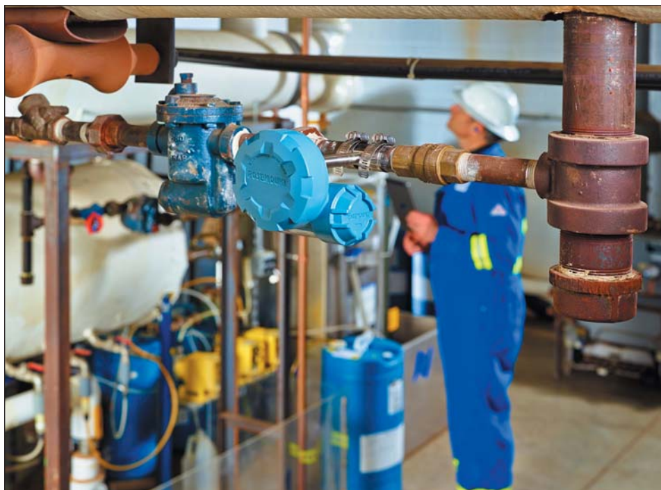
Рис. 3. Акустический преобразователь Rosemount 708 для контроля работы конденсатоотводчиков

Многие проекты становятся привлекательными в плане показателей ROI при использовании беспроводных технологий, поскольку не требуют прокладки проводных промышленных шин и связанных с этим дополнительных