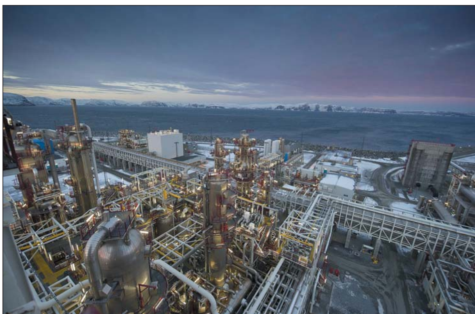
Рис. 1. Большинство предприятий применяют одновременно проводные и беспроводные решения, в зависимости от условий и требований процесса

По сравнению с традиционным токовым сигналом 4–20 мА технологии промышленных шин снижают расходы на проводку, упрощают