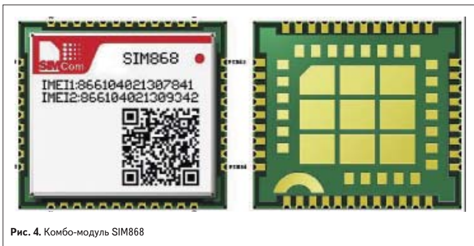
Рис. 4. Комбо-модуль SIM868

материнскую плату. Каждый из указанных компонентов отладочного комплекта можно приобрести отдельно.