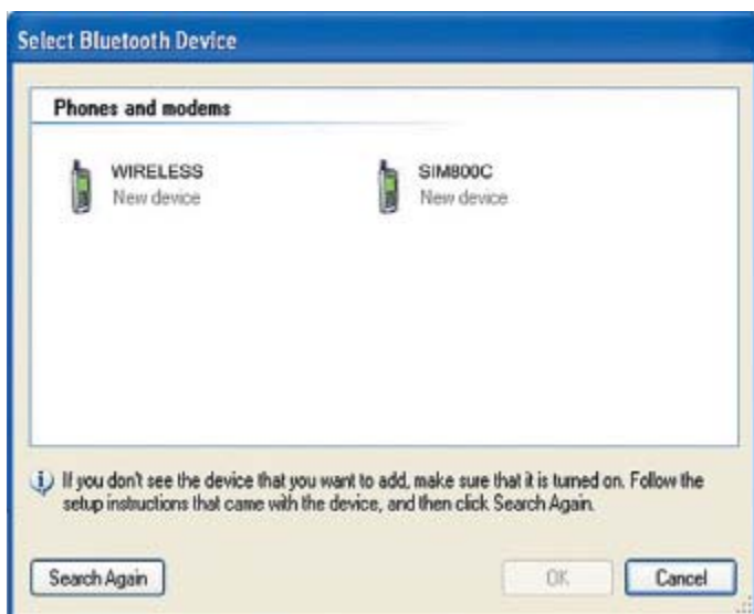
Рис. 2. Найденные Bluetooth-устройства

Если SIM800C выступает как SPP клиент, то: