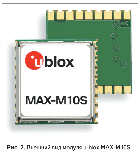
Рис. 2. Внешний вид модуля u-blox MAX-M10S

ции обмена с внешними устройствами. Питание интерфейсов подается по отдельной линии V IO (рис. 1). Универсальный асинхронный интерфейс модуля программируется на скорости передачи 4800–921 600 бит/с с точностью до 1%.